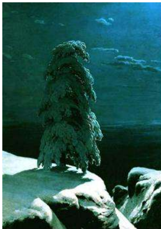
Иван Шишкин. На Севере диком... 1891

Такие задания направлены на выявление специальных предметных компетенций участников. В процессе выполнения задания необходимо провести анализ произведения, выявить его художественную идею, определить средства её реализации. В задании может быть предусмотрено проведение сравнительно-сопоставительного анализа разнородных (полярных) явлений художественной культуры. Участники олимпиады должны продемонстрировать понимание принадлежности произведения искусства той или иной национальной культуре, эпохе, художественной школе, стилю.