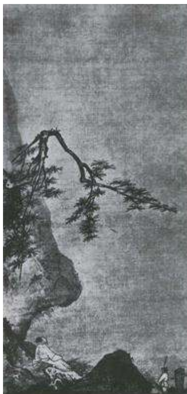
Ма Юань. Лунный свет. Живопись тушью на шелке. XII—XIII вв.